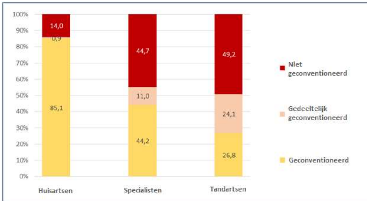
Grafiek 2: Verdeling van het aantal raadplegingen/contacten volgens conventionering per groep van zorgverleners met ten minste 500 contacten (2018)